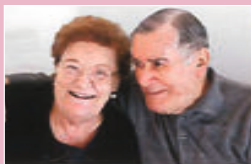
Consiglio Pia Di Giovanni Giulio Bovino (FG)